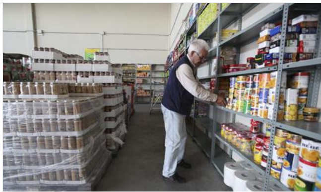
Banco de Alimentos de Huesca.